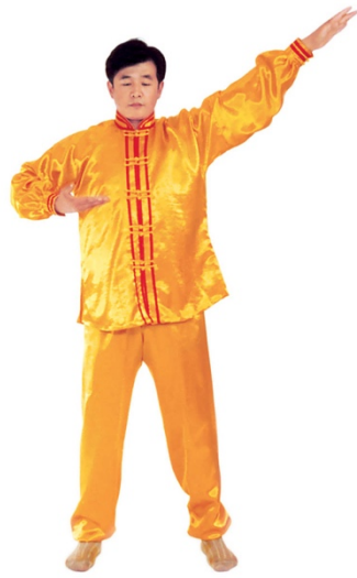
图 1 - 7