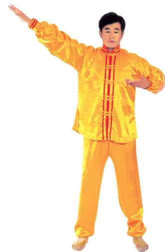
图 1 - 9