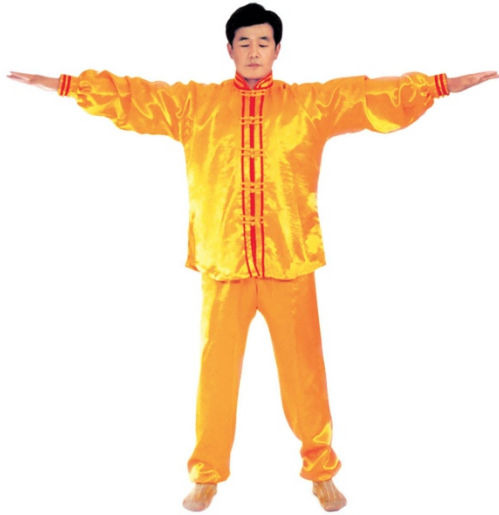
图 1 - 10