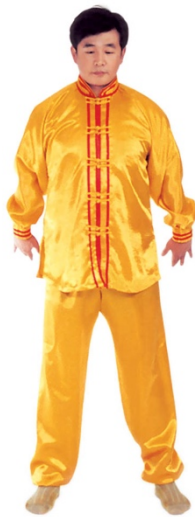
图 1 - 13