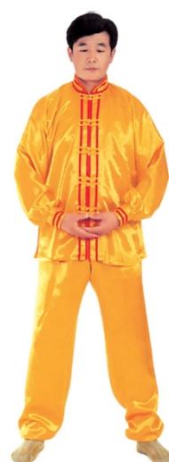
图 1 - 16