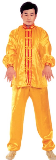
图 1 - 11