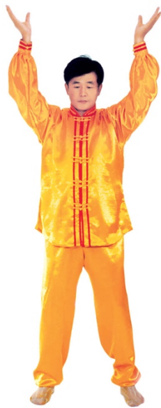
图 1 - 3

Quand les mains arrivent au bas-ventre, ensuite relevez-les à la hauteur de la poitrine pour les joindre (Fig.1-5). Ce geste demande les doigts contre les doigts, le bas de la paume contre le bas de la paume, mais en laissant les paumes creusées, les deux coudes un peu avancés, les deux avant-bras forment une ligne droite. (Sauf la salutation et le Jieyin , gardez les deux mains en forme de paume de lotus, les gestes suivants sont pareils).