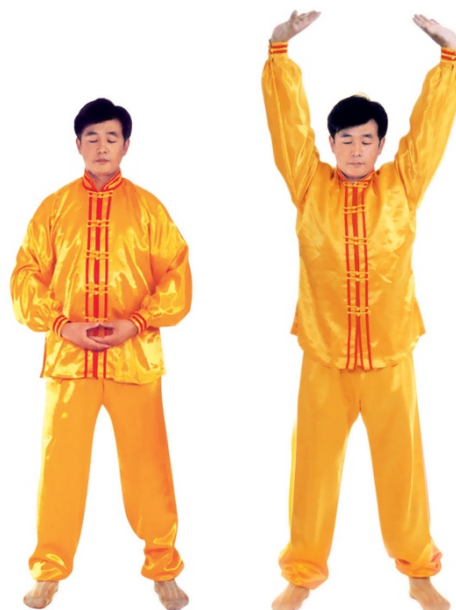
图 1 - 1

Les gestes commencent par le nœud de Jieyin , levez les deux mains en gardant le Jieyin , les deux jambes se tendent au fur et à mesure de la levée des mains, quand les mains arrivent devant la tête, le nœud du Jieyin se défait et les paumes tournent peu à peu vers le ciel, quand les mains arrivent au-dessus de la tête, les paumes sont tournées vers le ciel, les dix doigts se font face, les pointes des doigts sont distantes de 20-25 cm. (Fig.1-2). Et en même temps, tendez la tête vers le ciel, foulez la terre avec les deux pieds, redressez-vous et soulevez deux mains avec force depuis la racine des paumes, étirez peu à peu tout le corps, gardez cette position en vous étirant presque 2-3 secondes, relâchez immédiatement tout le corps. Revenez à une position de glisse surtout pour les genoux et les hanches.