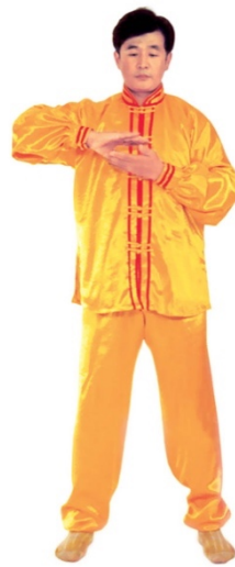
图 1 - 8