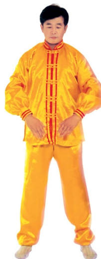
图 1 - 4