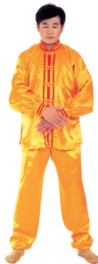
图 1 - 15