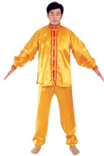
图 1 - 12