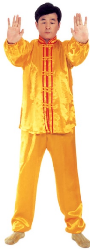
图 1 - 14