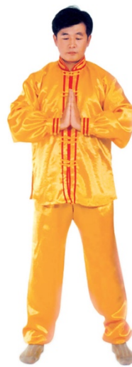
图 1 - 5