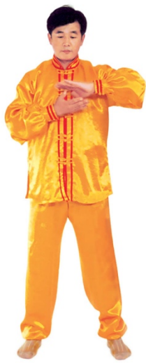
图 1 - 6

(Fig. 1-8). Répétez les gestes de la main gauche avec la main droite, c'est-à-dire, étendez l'avant-bras droit vers le côté droit en avant, la paume vers le sol, la main se lève à la hauteur de la tête ; la main gauche est encore devant la poitrine, paume vers le ciel. Après étirement (Fig. 1-9) relâchez immédiatement tout le corps. Retirez la main pour faire la salutation devant la poitrine (Fig. 1-5).